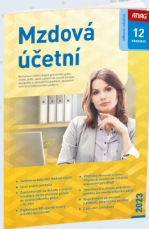
MĚSÍČNÍK MZDOVÁ ÚČETNÍ