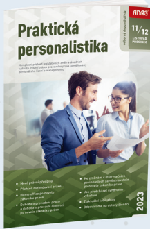
DVŮMĚSÍČNÍK PRAKTIČKÁ PERSONALISTIKA