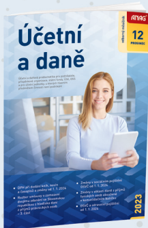
MĚSÍČNÍK ÚČETNÍ A DANĚ