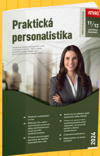
DVOUMĚSÍČNÍK PRAKTICKÁ PERSONALISTIKA