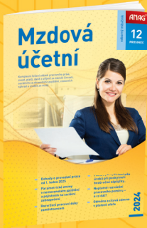
MĚSÍČNÍK MZDOVÁ ÚČETNÍ