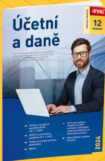
MĚSÍČNÍK ÚČETNÍ A DANĚ